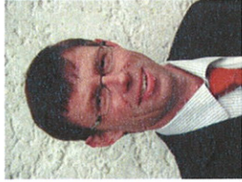
HP. Hürlimann Präsident