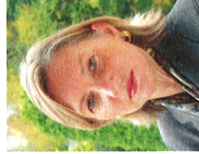
S. Bühler Rossé Kommunikation