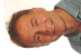
R. Krieger Anlässe/Wahlen